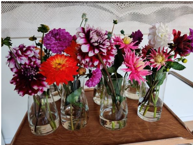
Blomster til patientstuerne på Hospice Søholm

Hver eneste gang vi samler lopper, sorterer og fordeler, er det en fornøjelse at opleve interessen for lopperne til fordel for Hospice Søholm. Tak til alle jer, der giver og tak til jer, der køber.